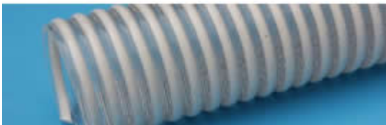
Серия 15/2-PVC-S5L Напорно-всасывающий шланг из ПВХ, армированный, облегченный

Напорно-всасывающий, армирован спиралью ПВХ. Легкий Для перекачки питьевой воды, пищевых продуктов таких как напитки, соки, пиво, вино, алкогольные напитки, молоко и пр.