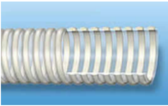
Серия 15/2-PVC-7N Шланг напорно-всасывающий. ПВХ. Пищевой

ТЯЖЕЛЫЙ. Напорно-всасывающий шланг ПВХ, пищевой, универсальный. Для перекачки питьевой воды, пищевых продуктов (напитки, соки, пиво, вино, алкогольные напитки, молоко и пр.), забора воды из скважин, во многих сельскохозяйственных технологиях.