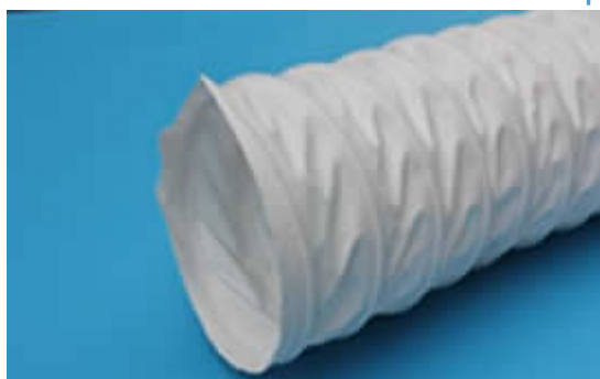
Серия 29/3-PVC-Vinil Воздуховод из полиэфирной ткани

Полиэфирная ткань со специальной пропиткой ПВХ, стальная пружинная спираль. Толщина стенки в межвитковом пространстве 0,3 мм. Транспортировка материалов с невысокими абразивными свойствами, отвод выхлопных газов и газов сварочного оборудования, отвод химических паров. Пригоден для внутреннего и наружного применения.