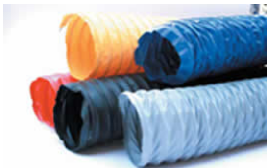
Серия 29/3-PVC-0,3 Легкий воздуховод. Пластиковая комбинация.